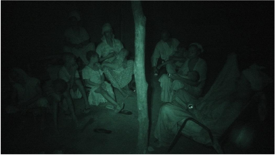
写真 1. 語りの場面